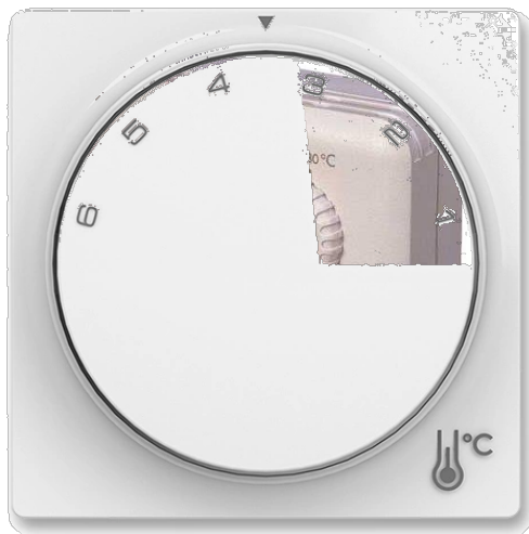
Termostat 5- 30 °C – ilustrační obrázek