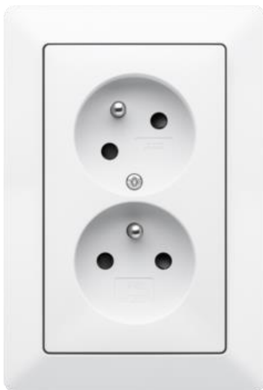
Dvojzásuvka pod omítku matná bílá – ilustrační foto