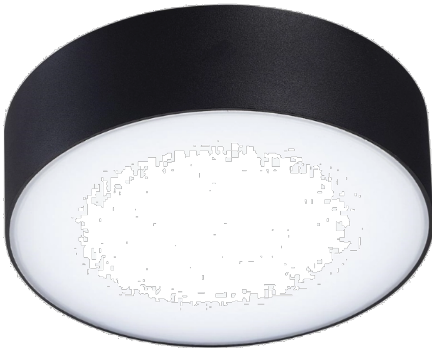
"C" svítidlo LED přisazené, 32W, 3200lm, 4000K, IP44 s pohybovým čidlem – ilustrační foto