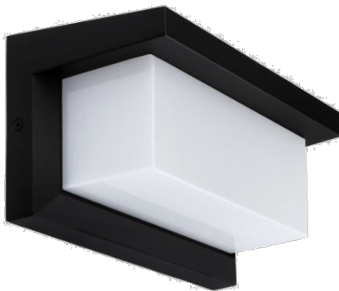
"B" svítidlo LED přisazené 32W, 3200lm, 4000K, IP44 – ilustrační foto