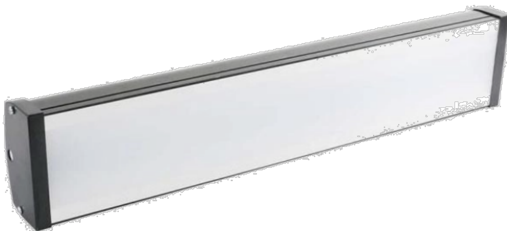
„D“ svítidlo LED 32W, 5500lm, 4000K, IP54 – ilustrační foto