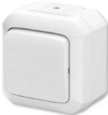
Vypínač na povrch bílý IP44 – ilustrační foto