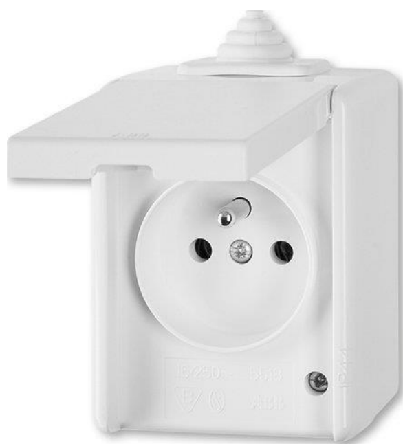
Zásuvka na povrch bílá – ilustrační foto