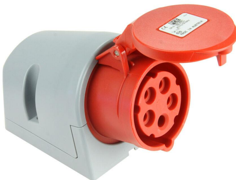
Zásuvka nástěnná 5 pólová 16A/400V, IP44 – ilustrační foto